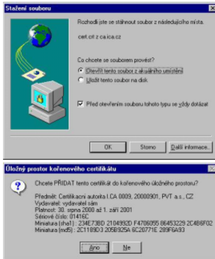
Obrázek č. 3 a 4